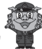
県警マスコット シーサー君

沖縄県警察では、沖縄県警察官B(高卒程度)採用試験の申込み受付を実施しています。 (警視庁・千葉県警察官B(男性)採用共同試験) 宮古島警察署でも受験案内、申込用紙の配布を行っています。